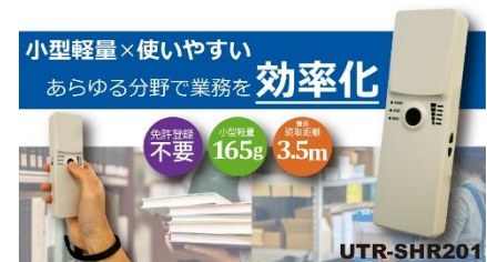
▲蔵書点検用ハンディリーダライタ