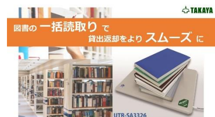
▲貸出し/返却カウンタ用アンテナ

◆本リリースに関するお問合せ先 タカヤ株式会社 事業開発本部 RF事業部 TEL : 03-5449-7045 E-Mail : rfid@takaya.co.jp